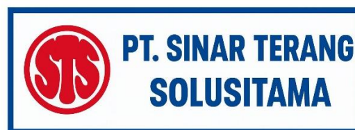
Gambar 2.1 Logo PT Sinar Terang Solusitama

Kantor Konsultan Pajak Bestari Partner yang berada di bawah naungan PT Sinar Terang Solusitama selalu berupaya untuk memberikan jasa konsultasi perpajakan dan berfokus pada pemberian layanan yang menjunjung tinggi integritas, profesionalisme, serta berkomitmen dalam membantu klien dalam mengoptimalkan kepatuhan pajak dan efisien finansial. Bestari Partner menyediakan layanan perpajakan pusat yang meliputi compliance pelayanan pajak bulanan, pelaporan SPT tahunan, jasa tax planning , jasa pendampingan pajak, konsultasi umum, dan jasa pembukuan.