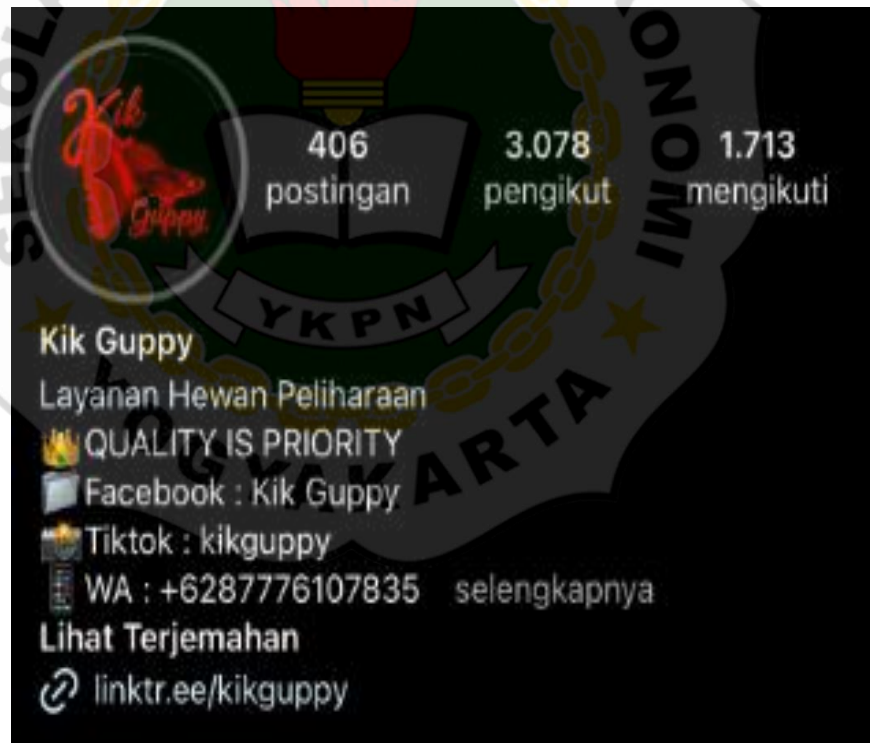
Gambar 6. Instagram “Kik guppy”

Jika ikan sudah didisplay berarti ikan tersebut sudah siap kita pasarkan. Bisa dikatakan ikan siap diposting baik itu di Instagram ataupun melalui tik tok. Biasanya pembeli ada yang datang ke toko untuk membeli secara langsung. Pembeli bisa kita berikan pilihan wadah yang akan digunakan. Jika pembelian melalui online maka produk kita kirimkan dengan kemasan yang sudah kita siapkan demi keamanan ikan sampai pada konsumen. Pengiriman bisa melalui driver online maupun ekspedisi.