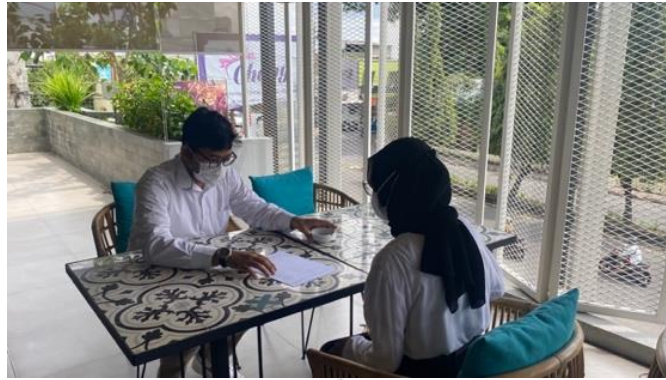
Gambar 2.1 Employee Recruitment