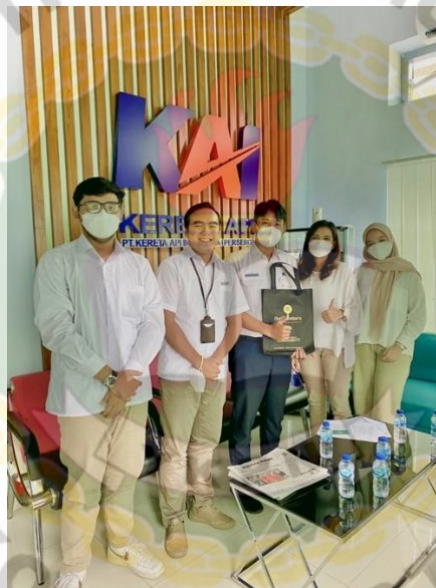
Gambar 2.4 Sales Call

Kegiatan ini dilakukan dengan cara mengunjungi perusahaan, instansi, dan universitas untuk mengenalkan produk dan jasa kami. Salah satu contohnya saya mengunjungi PT KAI Yogyakarta.