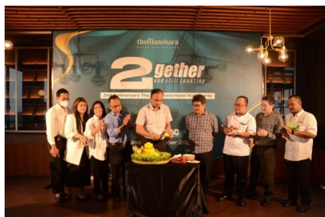
Gambar 2.3 Handle Anniversary Hotel