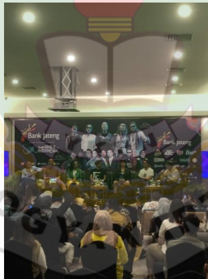
Gambar 2.2 Handle Press Conference

Kegiatan ini dilakukan dalam rangka mengikuti dan menjadi dokumentasi untuk Press Conference Konser Slank di Yogyakarta.